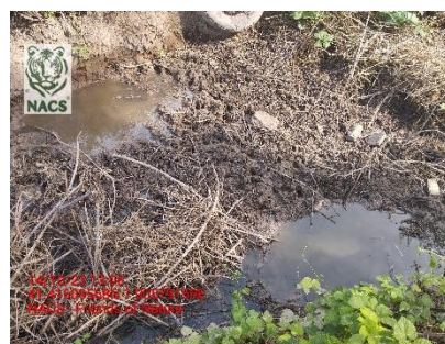
Seguimiento de un vertido de aguas residuales