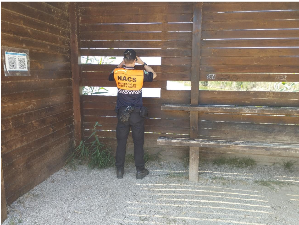
Tareas de vigilancia en el Delta del Llobregat