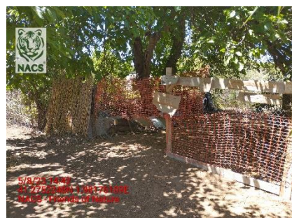
Denuncia por un huerto no autorizado