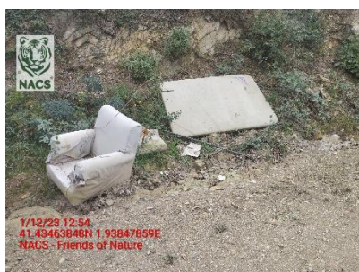
Seguimiento de un vertido de residuos

El Departamento de Medio Ambiente de NACS realizó 16 denuncias por infracciones al Medio Ambiente, principalmente por vertidos de residuos en espacios naturales y una denuncia por el montaje de un huerto no autorizado. Además se realizaron vigilancias en el Delta del Prat de Llobregat, en el Parque Agrario del Baix Llobregat, en los Gorgs de la Mola de Corbera de Llobregat, y en Collserola.