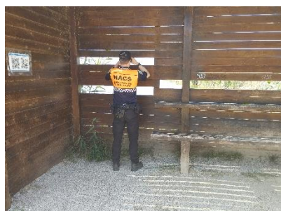
Vigilancia en el Delta del Llobregat